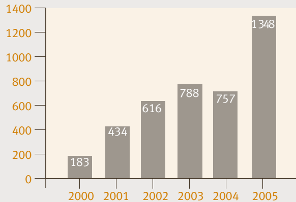
PROGRESSION DU NOMBRE D'ARTICLES ET REPORTAGES GÉNÉRÉS DANS LES MÉDIAS PAR LES TRAVAUX DE L'IEDM

Après avoir connu une augmentation rapide au cours des années précédentes, celle-ci a presque doublé l'année dernière. Quelque 1350 articles et reportages ont mentionné notre Institut en 2005, comparativement à 757 en 2004. La valeur totale de cette couverture médiatique a été estimée à 11,8 millions $ par des spécialistes de relations publiques, soit une augmentation de 48 % par rapport à l'année précédente.