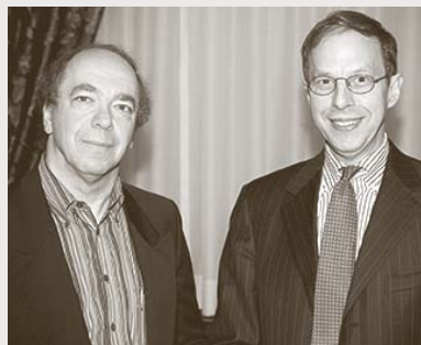
DÉBAT SUR LA VALEUR DES NOUVEAUX MÉDICAMENTS ENTRE JOEL LEXCHIN (À DROITE) DE L'UNIVERSITÉ DE TORONTO ET FRANK LICHTENBERG (À GAUCHE) DE L'UNIVERSITÉ COLUMBIA, 7 AVRIL 2005

nomie en 2002, y a prononcé un discours devant plus de 150 invités à l'hôtel Ritz-Carlton de Montréal.