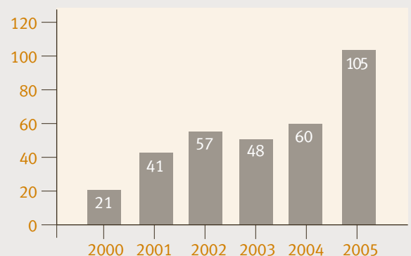
PROGRESSION DU NOMBRE DE TEXTES D'OPINION PUBLIÉS PAR L'IEDM DANS LES JOURNAUX ET MAGAZINES

Les travaux de l'IEDM font l'objet de discussion non seulement dans les médias montréalais, mais dans ceux de toutes les régions du Québec. Certaines de nos publications ont également eu un large écho à travers le pays. Nous avons eu une présence régulière – au mois une fois par mois – dans la page Opinion du National Post . On peut affirmer sans aucune prétention que même si les bureaux de l'Institut économique de Montréal sont situés dans la métropole du Québec, il est maintenant une voix reconnue et respectée à travers tout le Canada. Avec plus d'un demi-million de visiteurs uniques en 2005, notre site web bilingue rejoint quant à lui un public encore plus vaste, non seulement au Canada, mais dans le monde entier.