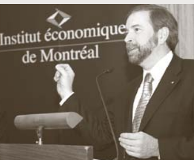
LE MINISTRE QUÉBÉCOIS DU DÉVELOPPEMENT DURABLE, DE L'ENVIRONNEMENT ET DES PARCS, THOMAS MULCAIR, LORS D'UN DÉBAT SUR LE TRAITÉ DE KYOTO, 29 NOVEMBRE 2005

L'Institut économique de Montréal n'est pas qu'une maison d'édition dont les études alimentent les débats dans les médias, mais est lui-même un lieu où des personnalités prestigieuses viennent croiser le fer publiquement. En 2005, nous avons ainsi organisé deux débats sur des sujets controversés, soit la valeur des nouveaux médicaments et l'impact du Traité de Kyoto sur l'environnement, avec entre autres le ministre de l'Environnement du Québec, M. Thomas Mulcair.